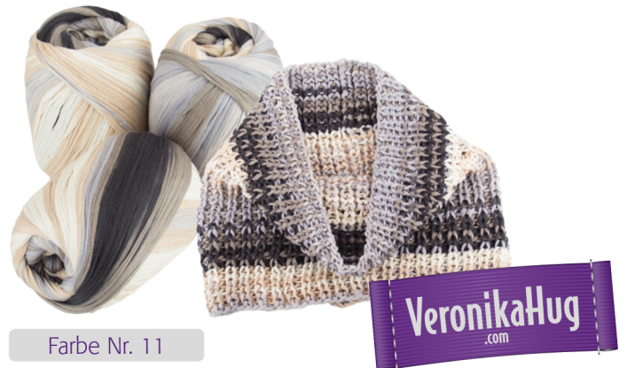
Farbe Nr. 11