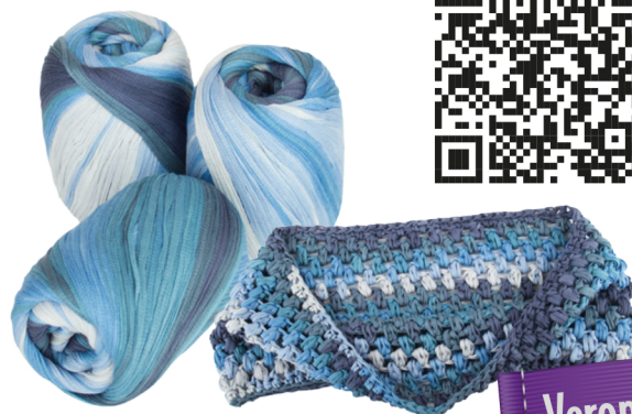
Farbe Nr. 12

Anleitungs-Video auf YouTube: https://www.youtube.com/watch?v=UyDceL7RneE