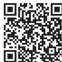
QR-Code zum Video