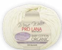
Farbe Nr. 02 natur