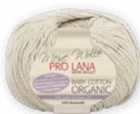
Farbe Nr. 05 sand