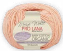
Farbe Nr. 25 apricot