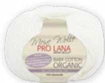
Farbe Nr. 01 weiß

100% Baumwolle/cotton Lauflänge 165m/50g Nadelstärke 3,0 – 3,5