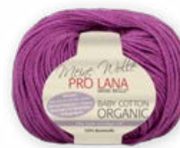
Farbe Nr. 44 fuchsia