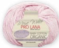
Farbe Nr. 33 rosa