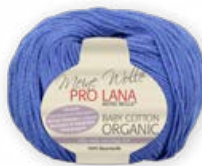
Farbe Nr. 51 royal