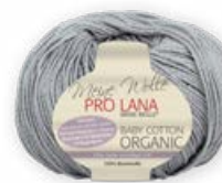
Farbe Nr. 95 grau