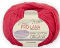
Farbe Nr. 30 rot