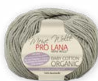
Farbe Nr. 12 fango