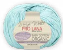
Farbe Nr. 64 azzurro