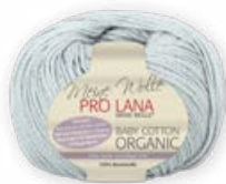
Farbe Nr. 91 nebel